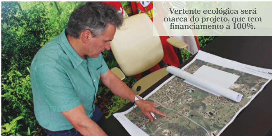
Vertente ecológica será marca do projeto, que tem financiamento a 100%.

A Junta de Freguesia de Fornelos viu aprovada a 'Eco Aldeia Vida', um projeto social que pretende criar habitação comunitária e colaborativa.