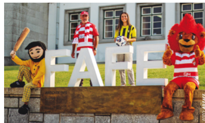
Mascotes Malapeiro e Justi uniram-se para promover 'fair-play'

A Associação Desportiva de Fafe regressou às vitórias, na receção ao São João de Ver, em jogo da 7ª jornada da Liga 3.