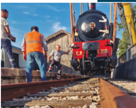
Linha ferroviária encerrou em 1986.