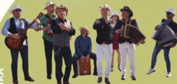
AMIGOS DE SOBREPOSTA