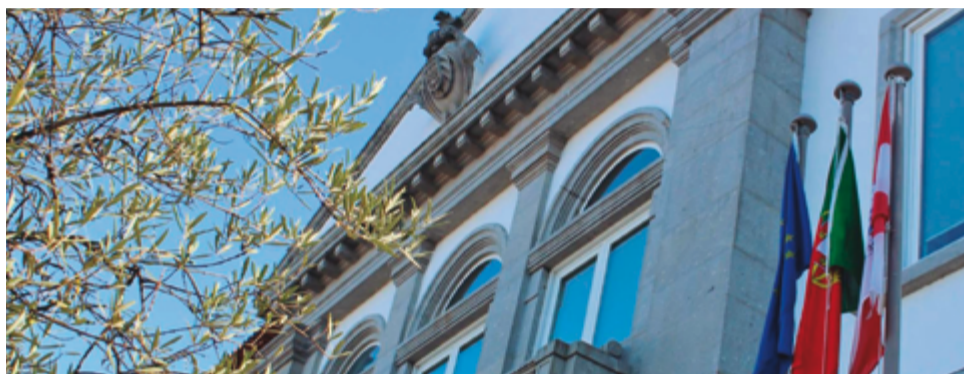
Sociedade de Recreio Cepanense com Medalha de Ouro e Andebol Clube de Fafe Medalha de Prata.