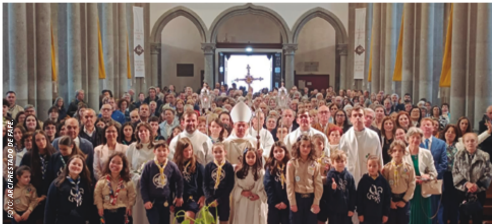
Bispos percorrem as 37 paróquias do arcebispo, até 21 de junho. Visitas Pastorais encerram com celebração eucarística, no Multiusos.